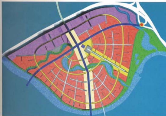
Delenie lokality na zóny Priestorovo-hmotové štúdie