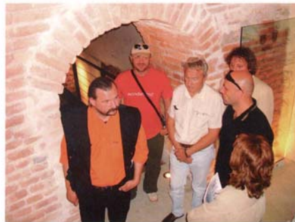
Odborná porota na prehliadke kazematy v sprievode autora.