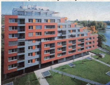
Víťazom CE.ZA.AR v kategórii Bytové domy je obytný súbor Karloveské rameno. Nominovaný bol aj na Stavbu roka 2007. Stavba J&T Real Estate stála 660 miliónov korún.

Víťazný projekt Karloveského ramena má podľa neho úzasný kontakt s vodou, ale ideálne urbanistické riešenie v tomto prípade muselo ustúpiť, pretože