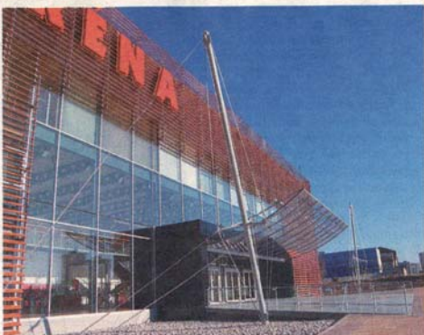
Stavbou roka 2007 sa v júni stala viacúčelová športová hala Aréna popradského ateliéru ARCHSTUDIO. Cenu udeľuje Združenie pre rozvoj slovenskej architektúry a stavebníctva ABF Slovakia. Aréna stála 230 miliónov korún.

neboli doriešené majetkovoprávne vzťahy k pozemkom. „Vyrastali sme v spoločnosti, kde všetko patrilo všetkým a dali sa robiť odvážne urbanistické riešenia. Dnes musíme rešpektovať vlastnícke vzťahy.“