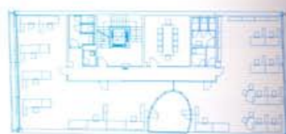
3. poschodie / 3 rd floor