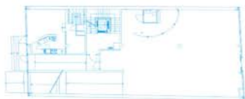
Prízemie / Ground floor