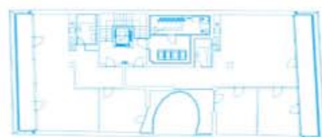
1. - 2. poschodie / 1 st - 2 nd floor