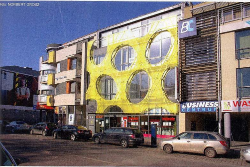
Cheese House: Syrový dom v Nitre bol nominovaný na cenu CE.ZAAR a Piranesi Award 2009.